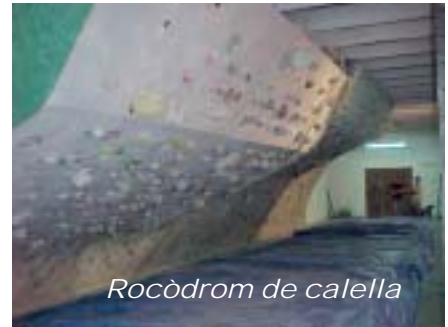
Rocòdrom de calella

Vàrem tirar-hi fotos; ens van explicar que se l'havien construït ells. Pel que vàrem veure estava fet amb plaques d'aglomerat i pintat amb una pintura de polièster, al darrere dels forats hi havia aranyes (són unes femelles que es claven a la fusta). Per la part del darrere hi havia un entramat de ferros de tota mena collats al sostre i a la paret. Els laterals estaven tapats amb un tendal d'aquells de ràfia plastificada. Per al terra ens varen explicar que havien agafat tot de matalassos vells embolicats tots junts amb un tendal d'aquell de camions. La idea de construir un rocòdrom d'aquesta mena ens va agradar, perquè era una instal·lació diferent de les altres que hi havia per aquí, també perquè era relativament fàcil de construir i sobretot perquè el preu que costaria construir-lo no seria gaire alt.