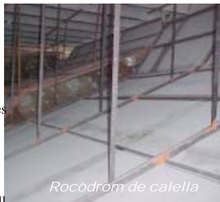
Rocòdrom de calella

Un cop allà, vam estar a punt d'haver de marxar sense poder-lo veure, perquè quan vàrem arribar i el vàrem trobar estava tancat. El conserge de l'edifici ens va dir que ell no tenia la clau, però que sempre hi solia venir algú. Després d'esperar una hora ben bona i ja estar resignats a haver de marxar sense veure'l va aparèixer per aquell carreró un tio amb pinta d'escalador i ens va ensenyar el rocòdrom.