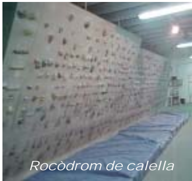
Rocòdrom de calella